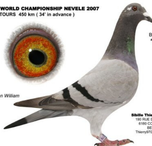
BE07-6322779 "EL TEIDE"