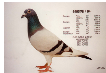
Bildet over viser "De 178". Sønn av "231". Super kappflyger og avler hos Flor Engels.