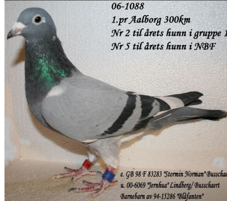
06-1088 1. pr Aalborg 300km Nr 2 til årets hunn i gruppe 1 Nr 5 til årets hunn i NBF