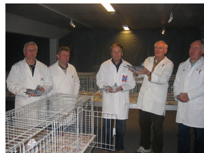
Dommerne koser seg med bedømmingen.