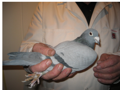
Dommeren kjenner lett duens tyngdepunkt ved å "veie" duen i hånden.

Man bør videre sjekke ballansen på dua. Med duens ballanse menes en forståelse av tyngdepunktets plassering. Ligger tyngdepunktet langt framme når du holder dua i hånden, vil den virke tung. Duen har da som regel et for dypt brystbein, eller så er duen for fet. Når man bruker begrepet "dypt" om en dues brystben, er det nærliggende å trekke paralleller til baugen i skroget til en båt. En altfor dyp båt, eller brevue for den saks skyld, er ikke å foretrekke. Det være seg at duen er enten for dyp eller fet, vil det i begge tilfeller bli trekk hos dommeren. Er duene for fete må du regulere foringen på en langsiktig og fornuftig måte fram til utstillingen. Man skal i hovedsak trappe opp foringen mot utstillingen ikke omvendt. Slanking like før utstillingen setter ned duas form og vitalitet.