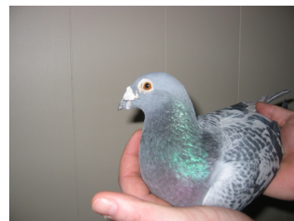
En flott maskulin type brevue i hånden til dommeren.