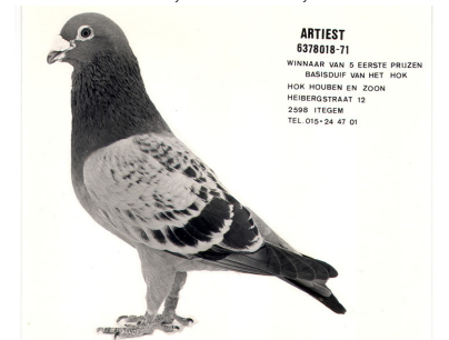
Bildet over viser ”Jonge Artiest” sin far: ”De Artiest”.