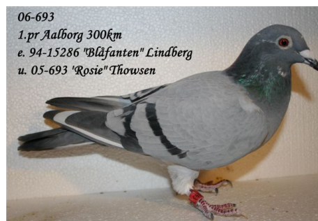
06-693 1. pr Aalborg 300km e. 94-15286 "Blåfantan" Lindberg u. 05-693 "Rosie" Thowsen