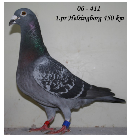
06 - 411 1.pr Helsingborg 450 km