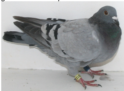
Vinner av SBU-finalen: Nor-09-1512. Oppdretter: Steinar Thowsen.

se duene komme, men medlemmer fra Fredrikstad, Oslo og Tønsberg var også der. Været var upåklagelig, og