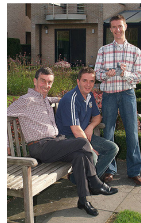
En av brødrene Herbots med sine to sønner. Bildet er fra 2008.

Denne hannen fløy i løpet av 5 sesonger 19500 premie-kilometer for sine eiere, brødrene Herbots. Han fløy 96 premier hvor han var blant de 4% beste. På 64 av sine premier var han blant de 10 % beste. Han vant 9 førstepremier, og ble beste esdue i 1976, 1977, 1978 og 1979. I 1978 ble han vinner av en kappflygning der første premien var en bil. I stammen til denne duen ligger det duer fra Van Hee og Desmet-Lippens. Denne hannen betraktes som stamfaren på slaget til Herbots.